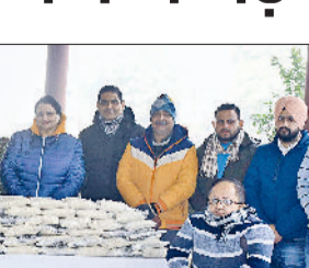
पानीपत। जरूरतमंदों के लिए एकत्रित किए गए राशन के साथ स्टाफ।