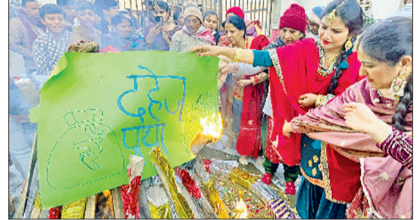
पानीपत। संगत लोहड़ी की अग्नि में दहेज प्रथा के पोस्टर जलाते हुए।