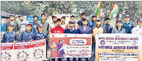
पानीपत। जागरूकता रैली निकालते आर्य स्कूल के स्वयंसेवक।

आर्य वरिष्ठ माध्यमिक विद्यालय में आज एनएसएस शिविर के छठे दिन के दौरान आज एनएसएस डॉक्टर ने गर्भीर बीमारियों के रोकथाम के प्रति एक जागरूकता रैली निकाली गई। रैली की शुरुआत सिविल हॉस्पिटल के मुख्य डॉक्टर द्वारा की गई। वहीं डॉक्टर ने बच्चों को पहले टीबी और एड्स जैसी बीमारियों के बारे में जानकारी दी और कहा कि आप समाज की मुख्य धारा हो। इसलिए समाज में जाकर