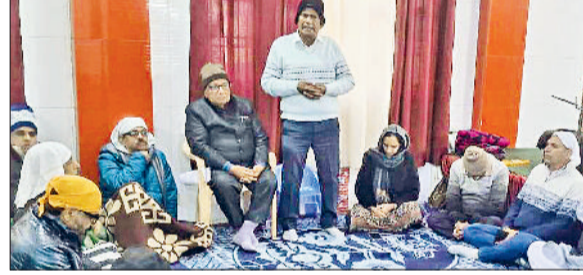
पानीपत। बाबा बंदा सिंह बहादुर सिख संप्रदाय की बैठक में मौजूद सदस्य।