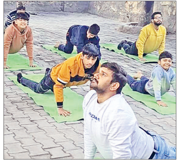
पानीपत। गांव बराना में योग करते ग्रामीण।